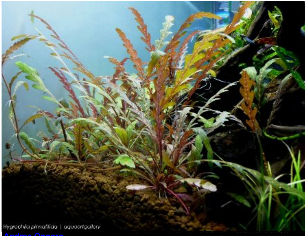
Hygrophila pinnatifida | aquarigallery