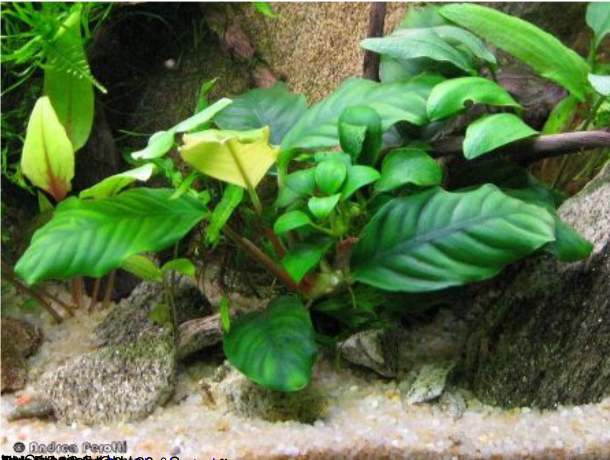
© Andrea Perotti [[ Anubias barteri ]]

Venerdì 31 Dicembre 2010 23:21 - Ultimo aggiornamento Sabato 01 Gennaio 2011 01:07